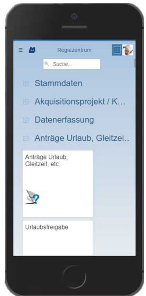
Das Regiezentrum der MARIPROject App.

MARIPROject unterstützt sowohl Strichcode- als auch QR-Code®-Erkennung.